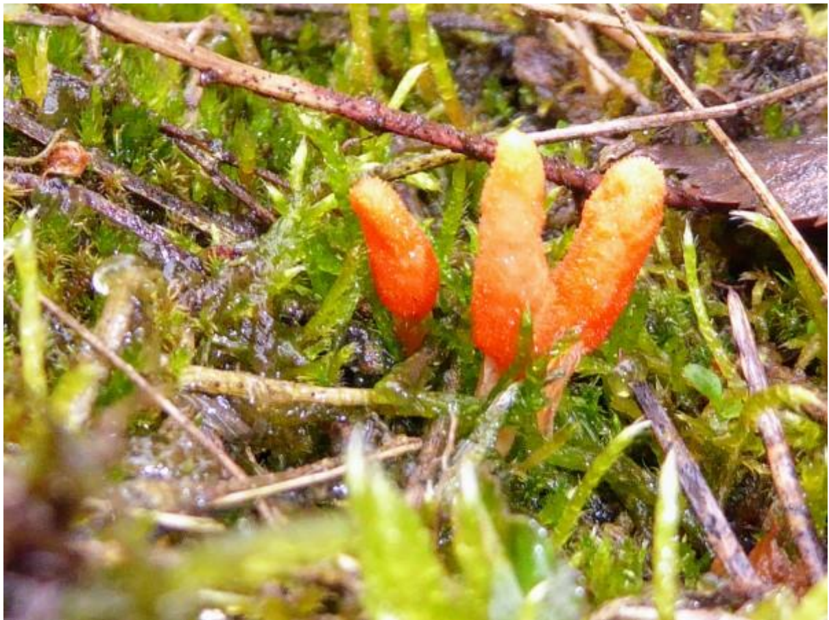
Deze paddenstoel werd een rups fataal. De rupsdoder