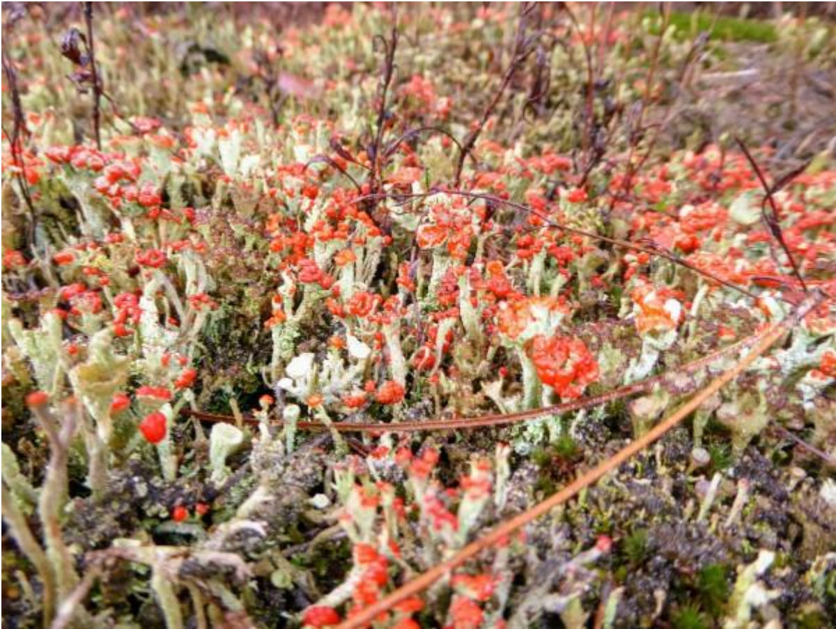
Dit rood bekermos stond er massaal